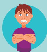
Erupción de manchas rojas en el cuerpo