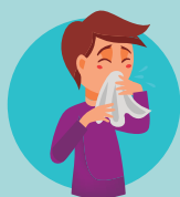
Secreción nasal (moqueo)