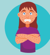
Erupciones cutáneas en el cuerpo