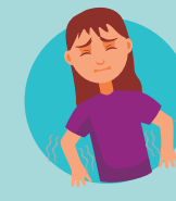
Debilidad muscular en brazos o piernas